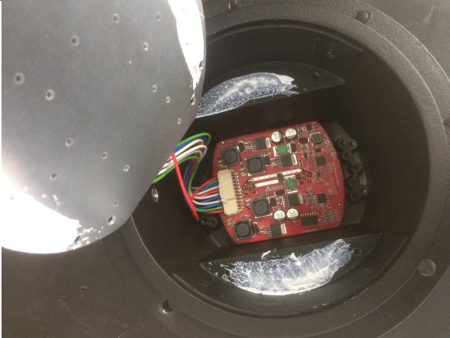
Opened View after tests